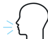
Troubles du langage et de la parole